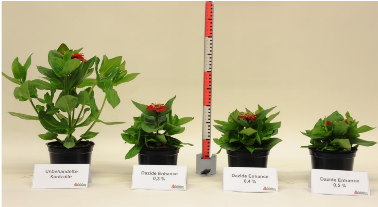
Abb. 1: Alle dazide® ENHANCE Varianten unterscheiden sich signifikant von der Kontrolle. Die am höchsten konzentrierte Hemmstoffvariante erzeugte die kompaktesten Pflanzen.