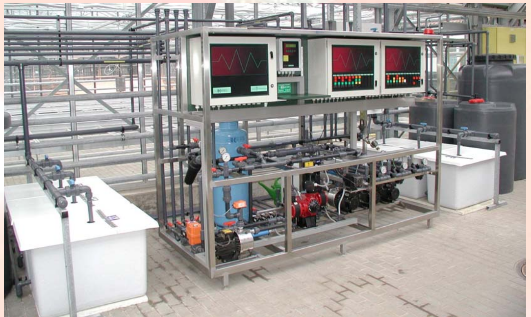
Sercom Regeltechnik (Unit): Düngung über Einzelnährstoffe