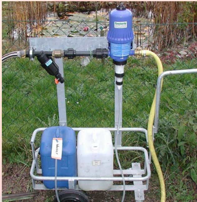
Dosatron: Düngung über einen Volldünger (15+5+25) im Wechsel mit Kalksalpeter

Ist die Düngung von Tomaten auf Torfsubstrat alternativ zur Sercom Regeltechnik auch über einen Dosatron möglich und wirtschaftlich sinnvoll?